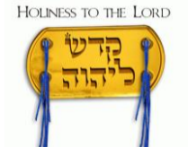
The Golden Crown of the High Priest הציץ