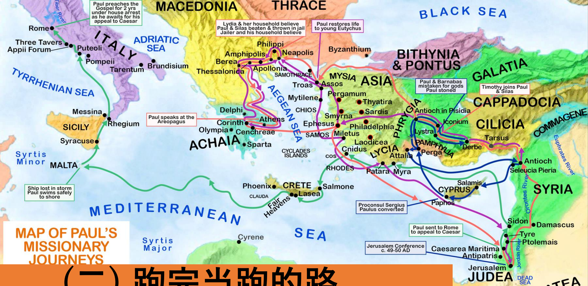
MAP OF PAUL'S MISSIONARY JOURNEYS